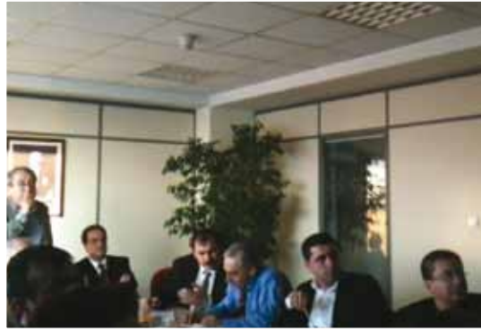
• TMD Çevre Birimi Toplantısı