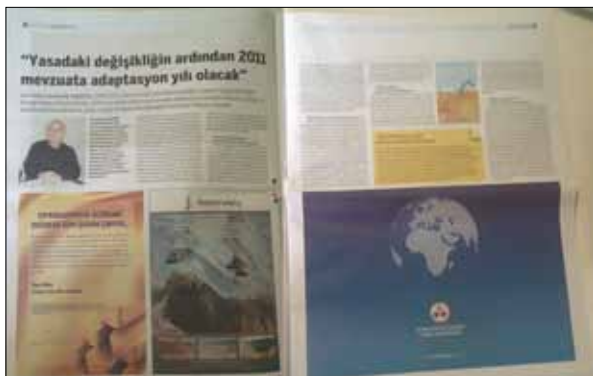
Dünya Gazetesi Madencilik Eki Mart 2011