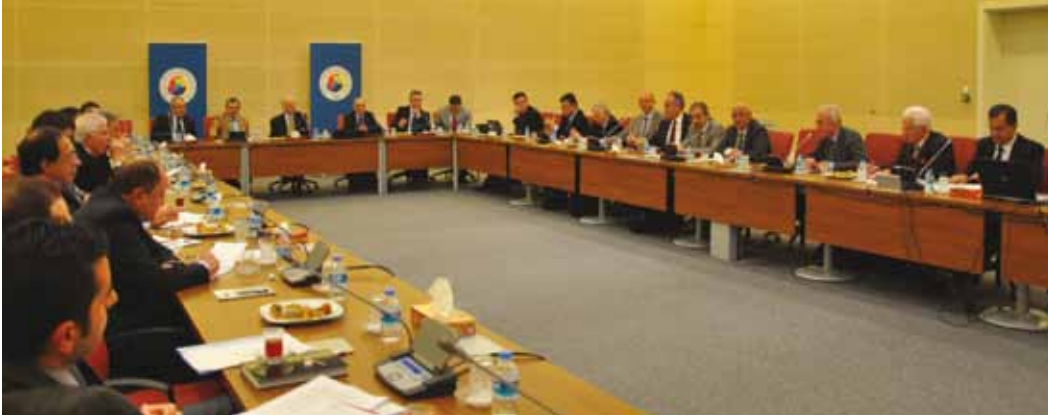
• TOBB Türkiye Madencilik Meclisi Toplantıları