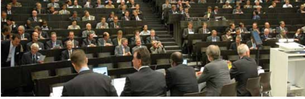
• Uluslararası Aachen Maden Sempozyumu - Maden Sektöründe Sürdürülebilir Kalkınma (Aachen- Almanya, 14-17 Haziran 2011)