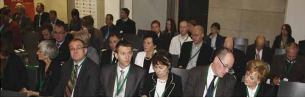
• Maden Kaynaklarının Sürdürülebilir Üretimi ve Tüketimi - AB'nin Sosyal Ajandası ile Kaynak Verimliliğinin Entegrasyonu Toplantısı (Wroclaw- Polonya, 20-22 Ekim 2011)