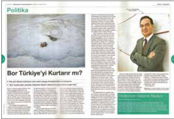
Businessweek Dergisi Ocak 2012