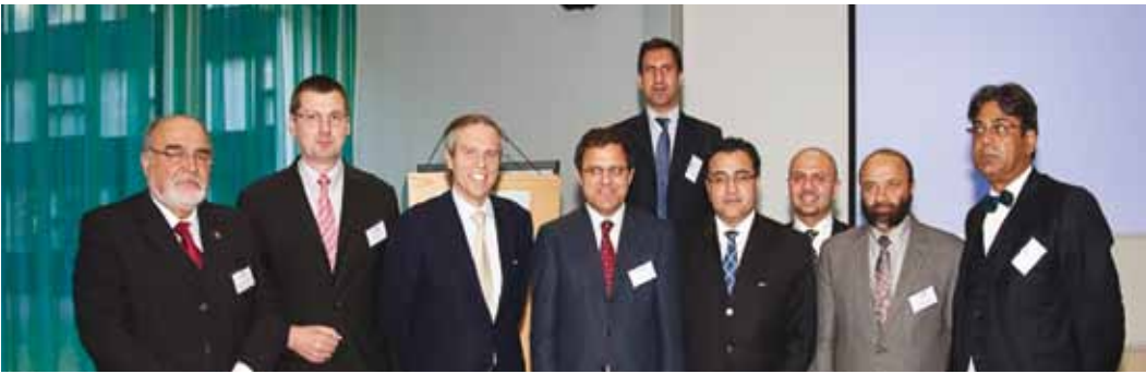
• Avrupa Kritik Hammaddeler Konferansı (Brüksel- Belçika, 9 Mart 2012)