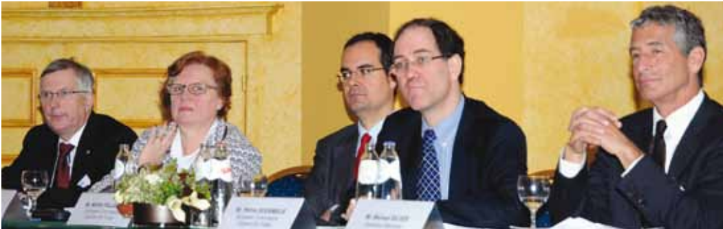
• Avrupa Kritik Hammaddeler Konferansı (Brüksel- Belçika, 9 Mart 2012)