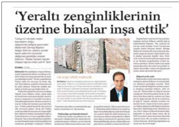
Dünya Gazetesi 15 Şubat 2012