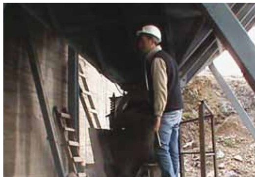
• Mesleki Eğitim - Madkim Madencilik - Mustafakemalpaşa-Bursa