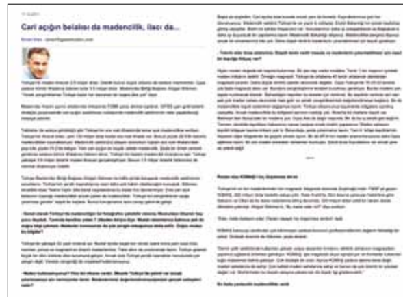
Star Gazetesi 17 Ocak 2012