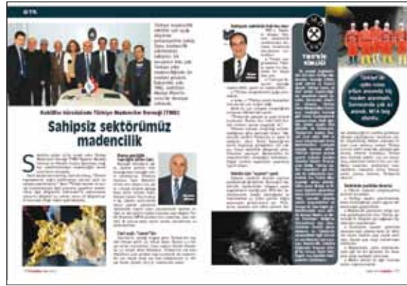
Kobi Efor Dergisi Mart 2012