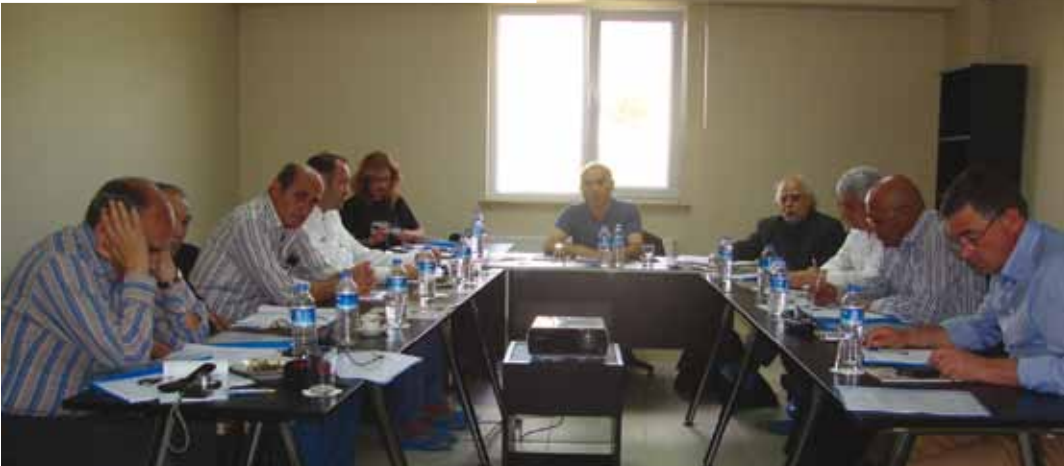
• Türkiye Madenciler Derneği Mayıs 2011 Yönetim Kurulu Toplantısı-Türk Maadin Şirketi'nin Eskişehir Kavak İşletmesi