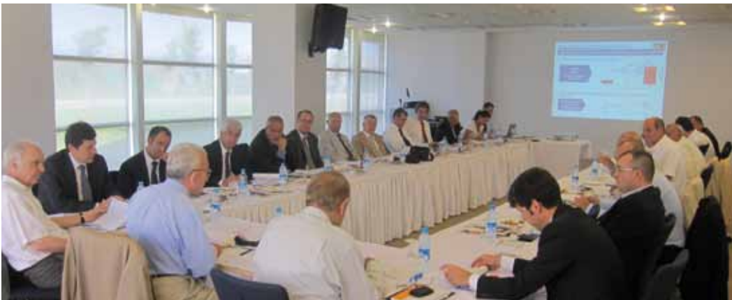
• 2023 İhracat Stratejisi Maden Sektörü Eylem Planları Projesi Toplantıları