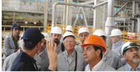
• Türkiye Madenciler Derneği Eylül 2011 Yönetim Kurulu Toplantısı-Eti Maden İşletmeleri Emet Bor İşletme Müdürlüğü